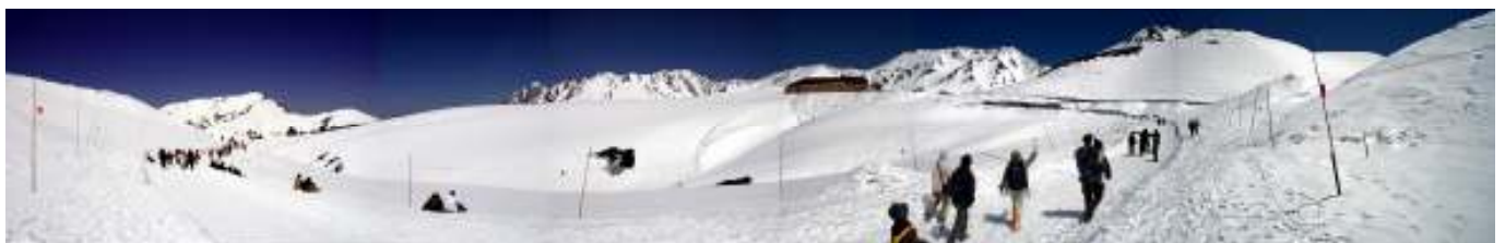
パノラマロードよりホテル立山を望む